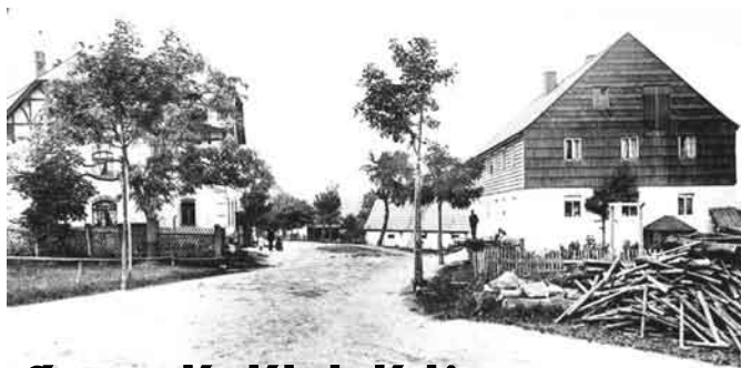
Gínovec: nemecká a rakúsko-uhorská colníca

dapešti na schôdzi štátneho úradníctva a služobníctva uzniesli, že ak nebude navýšenie razantnejšie, obrátia sa s deputáciou priamo na panovníka. Vláde tiež adresovali vyhrážku, že ak im nebude vyhovené, budú sa organizovať v rámci sociálno-demokratického hnutia. Českí financí to (možno zo závidia) okomentovali starým uhorským príslovím „Extra Hungariam non est vita, et si est vita, non est ita (Mimo Uhier nie je život, a ak predaš nejaký je, tak nie je takýto).“ V Uhorsku sa štátnym zamestnancom poskytovala aj podpora pri výchove detí a návšteve škôl. Išlo o finančnú podporu – štipendium od 400 do 700 korún ročne alebo umiestnenie dieťaťa v školskom internáte.