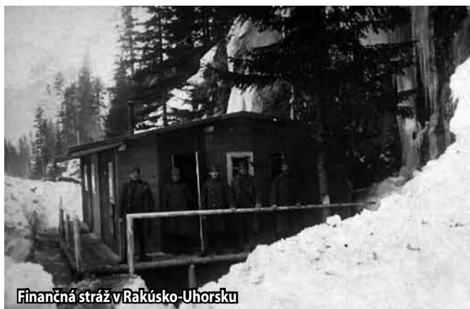
Finančná stráž v Rakúsko-Uhorsku

Financí a colníci závideli železničným zriadencom vlastné kuchyne, kde sa dalo lacno najesť, vlastné opravovne obuvi, uhlie za režíjnu cenu a voľné lístky na vlak. V zime 1917 im vadili nevykúrené kancelárie a ponosovali sa na nadriadených, ktorí neboli v tomto ťažkom hospodárskom období veľmi ochotní žiadať o zvýšenie paušálu na vykurovanie. Financcí sa problém sa snažili riešiť tak, že si brávali kancelársku prácu domov, resp. úradovali len pár dní v týždni. Ako nevďačnú povinnosť vnímali aj výpomoc okresným hejtmanstvám (na Sloven-